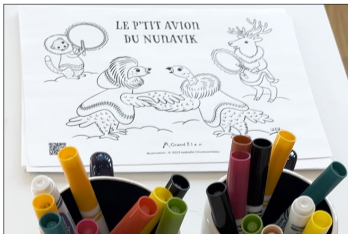
Activité de coloriage avec l'illustratrice