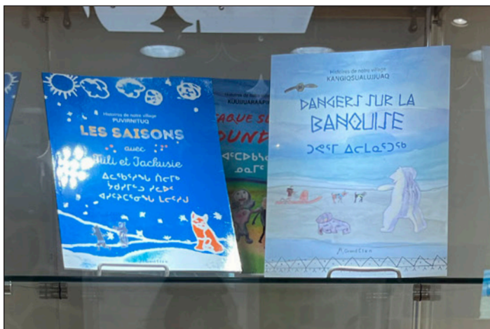
Liste de lecture thématique