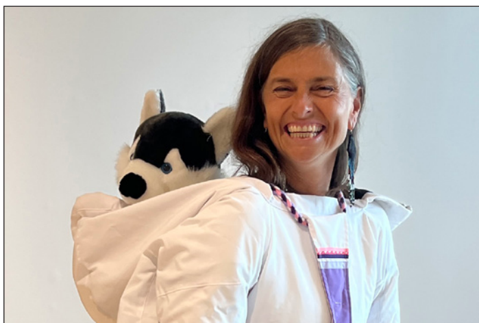
Heure du conte avec l'auteure