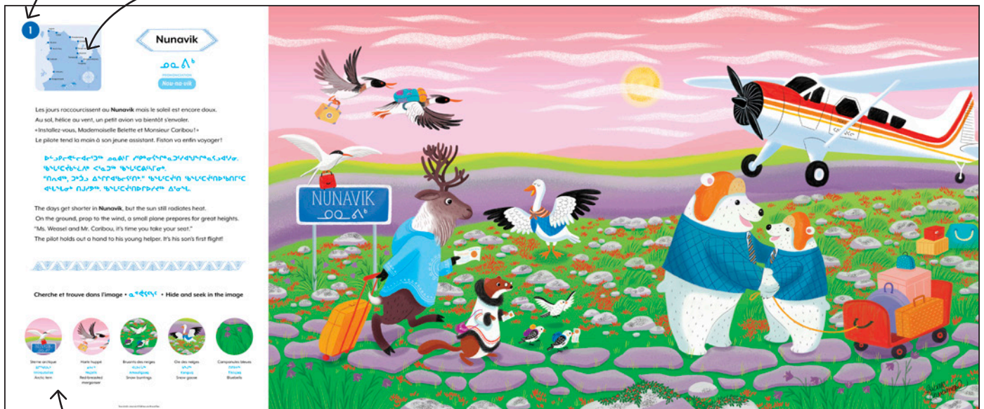
Illustration Image grand format

Cherche et trouve des animaux, des plantes et des éléments culturels du Nunavik en français, anglais et inuktitut